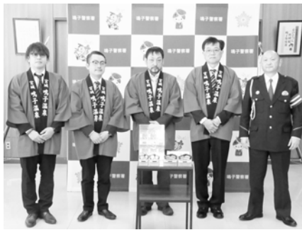
↑鳴子警察署で行われた交付式

鳴子温泉旅館組合では、下駄に貼る反射材シールを準備して組合員の17施設に配布し、温泉街を下駄を履いて歩くお客様の交通事故防止への取り組みを行いました。4月12日には、鳴子警察署にて交通事故防止協力依頼交付式が行われ、かかと部分に反射材が貼られた下駄が披露されました。