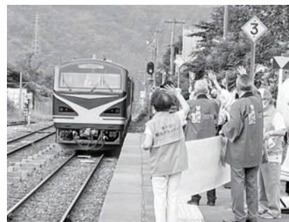
2020年8月10日 リゾートみのり最終運行