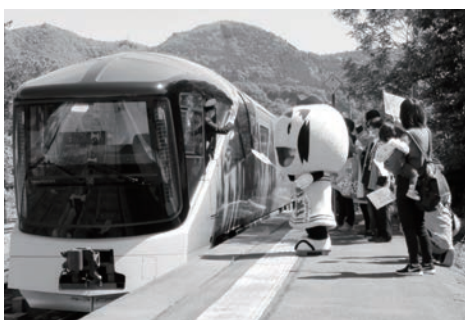
2023年5月 トランスイート四季島運行