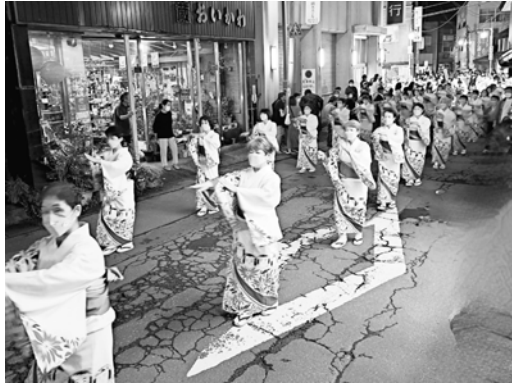
※昨年のこけし祭りの様子

こけし製作実演展示即売 鳴子漆器展・江戸下町職人展 こけまつマルシェ 〈会場：温泉街〉18時30分〜 フェスティバルパレード 張りぼてこけし・鳴子踊り