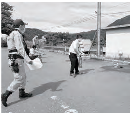
※模擬消火器を使用した消火訓練の様子

7月14日に鳴子温泉駅・玉造商工会鳴子事務所・鳴子温泉郷観光案内所の合同消防訓練が行われました。鳴子消防署員の方からのご指導を受けながら、出火時の初期消火や駅構内の避難誘導の確認、通報訓練などを行い、有事の際に慌てないよう訓練を実施しました。消防訓練は年2回行っておりますが、お客様や地域の方の安全を第一に、まずは火を出さないことを心がけてまいります。