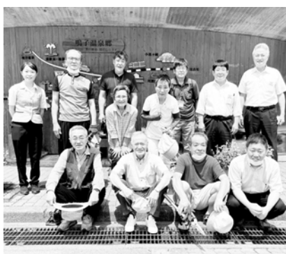
※ご協力いただいた皆さま

夏休みシーズン前に毎年行う「鳴子温泉駅前クリーン作戦」を7月14日に実施しました。この日は太陽が照りつけ暑い中の作業でしたが、皆さまにお手伝いいただき雑草やゴミを取り除きました。おかげさまで綺麗な駅前でお客様をお迎えすることができま。ご協力いただいた皆さま誠にありがとうございます。