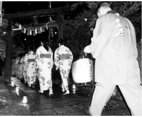
※以前の行列の様子