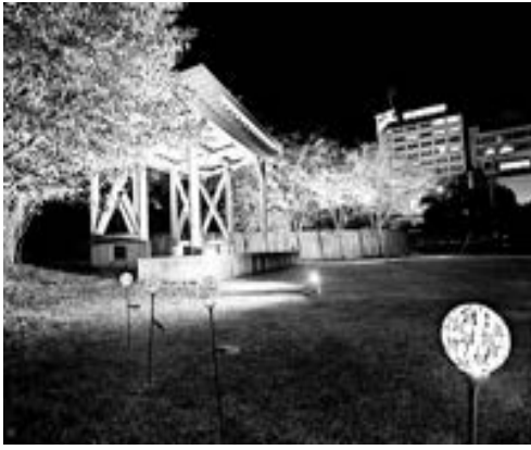
ライトアップしているゆめぐり広場

今年も「ゆめぐり広場」秋のライトアップが開催。広場の木々や舞台ステージが「EDライト」で照らされています。ご夕食後などに夜の温泉街を下駄を履いてカラコ歩いてみませんか？ 【点灯期間】令和5年11月中旬頃まで 17時00分～24時00分 【場所】鳴子温泉駅前ゆめぐり広場 【問合せ】鳴子温泉観光協会 Tel 0229-83-3441