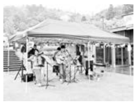
10月15日開催 音Re:湯(ワリ-1-) in ゆめぐり広場手湯 雨の中でも陽気な音楽で楽しく♪

10月1日開催 おおさき食楽まつり in ゆめぐり広場 4年ぶりに復活！ 初の鳴子温泉街での開催