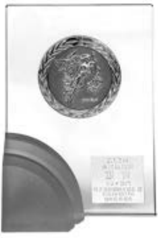
→仙台広告賞「銀賞の盾」

鳴子温泉郷観光協会では昨年度「鳴子温泉郷へ行こう！」というラジオの20秒CMをFM仙台で流しました。このCMはFM仙台CMコピーコンテストで一般から公募し優秀賞を受賞した作品で、昨年の10月から1月の間に放送されました。今回このラジオCMが仙台広告協会とテレビ局各社が主催する『第53回仙台広告賞』ラジオCM部門で銀賞を受賞しました。先日、仙台のホテルで授賞式が行われ銀賞の盾と副賞を頂いております。なお、放送された20秒CMはFM仙台のホームページから試聴できます。『第11回dam efmcmmコピーコンテスト』で検索してみてください。(今年度の12回CMコピーコンテストでは最優秀賞を受賞しています)