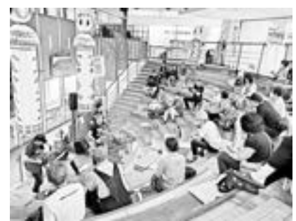
9月30日・10月1日 アコースティックライブ in 鳴子温泉 音楽が響きわたる 鳴子温泉駅待合室