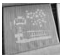
寄贈いただいた座布団