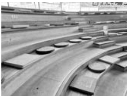
鳴子温泉駅待合室の様子

東北イノアック様よりウレタンを素材とした座布団120枚を大崎市へ寄贈いただきました。座布団は「なる子ちゃん」や「パタ崎さん」、陸羽東線をイメージしたプリントで色や形も様々。カラフルな座布団は鳴子温泉駅待合室で活用させていただきます。